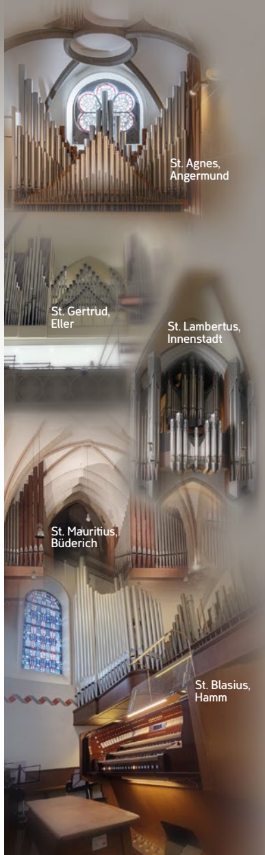
St. Agnes, Angermund