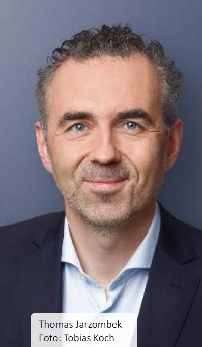
Thomas Jarzombek

„Drittstaatenmodell“ geordnete Verfahren ermöglichen. Für diejenigen, die bleiben, setzen wir auf klare Integrationsanforderungen, wie die Teilnahme an Sprach- und Integrationskursen sowie die Einhaltung unserer gesellschaftlichen Werte, um ein friedliches Miteinander zu gewährleisten. Das christliche Gebot der Nächstenliebe verpflichtet uns, Menschen in Not beizustehen, doch es geht auch um Eigenverantwortung und die Bereitschaft, sich in unsere Gesellschaft einzubringen. Unser Ziel ist eine Balance zwischen Humanität und Ordnung,